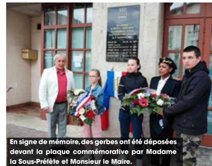
En signe de mémoire, des gerbes ont été déposées devant la plaque commémorative par Madame la Sous-Préfète et Monsieur le Maire.