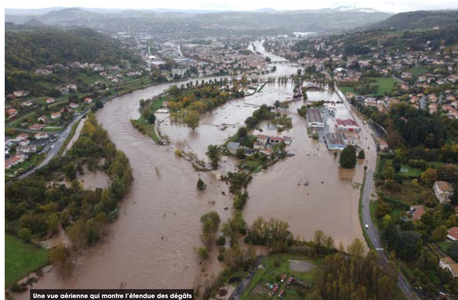
Une vue aérienne qui montre l'étendue des dégâts