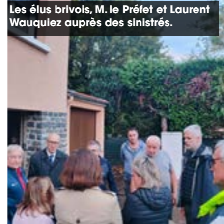
Les élus brivois, M. le Préfet et Laurent Wauquiez auprès des sinistrés.