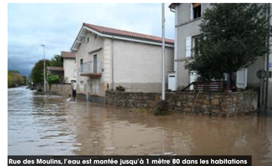
Rue des Moulins, l'eau est montée jusqu'à 1 mètre 80 dans les habitations

L'eau envahit les rez-de-chaussée des maisons le long de la route du Monteil et de la rue des Moulins. Le boulo-drome, ainsi que nos terrains de sport, sont ravagés par des troncs d'arbres et des débris. Planet Air voit également ses équipements emportés par le fleuve, dévastés en un instant. Ces crues, violentes et soudaines, se retirent presque aussi vite qu'elles arrivent, laissant derrière elles des dégâts considérables chez les habitants et dans nos infrastructures publiques . Marie-Agnès Petit, présidente du Département , vient apporter son soutien aux sinistrés en mairie.