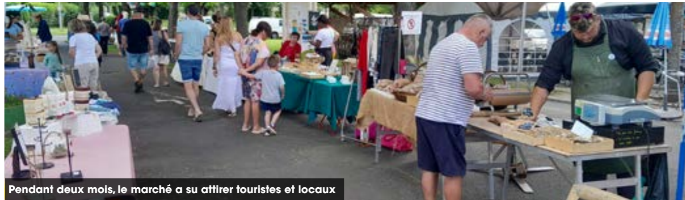
Pendant deux mois, le marché a su attirer touristes et locaux

La saison 2024 a été un véritable succès, marquant un record en termes de fréquentation avec 2 666 séjours. La part de la clientèle étrangère a augmenté, avec en tête nos amis allemands.