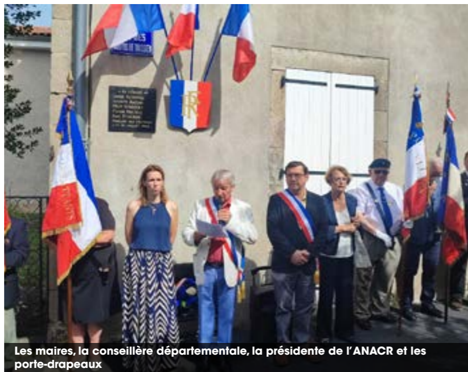
Les maires, la conseillère départementale, la présidente de l'ANACR et les porte-drapeaux

■ À Brives-Charensac , un hommage a été rendu rue des Martyrs , où un discours a rappelé le sacrifice des résistants fusillés, en présence des jeunes du SNU en stage d'une semaine à la Chartreuse et des élus.