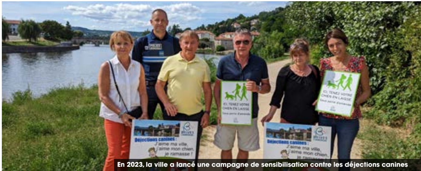
En 2023, la ville a lancé une campagne de sensibilisation contre les déjections canines

Dans le prolongement de notre campagne de lutte contre les déjections canines, une nouvelle initiative sera lancée pour cibler les mégots , dont l'accumulation sur les trottoirs est une source de pollution facile à éviter. Il en va de même pour les chewing-gums , qui persistent des années au sol. Face à ces incivilités, devons-nous envisager des sanctions ?