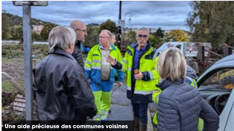
Une aide précieuse des communes voisines

Le samedi , les élus assistent les habitants route du Monteil et sur l'aire de jeux d'Audinet. Un élan de solidarité réchauffe les cœurs de tous : sinistrés, élus, agents et bénévoles. Les communes voisines , comme Espaly-Saint-Marcel, ont envoyé des agents pour participer au nettoyage, tout comme Le Puy-en-Velay, Saint-Germain-Laprade et Chadrac. Des élus ont préparé des casse-croûtes pour les agents municipaux et 150 sandwiches pour les bénévoles venus nettoyer les aires sportives.