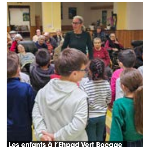
Les enfants à l'Ehpad Vert Bocage

Un projet « L'art d'être en forme » sera également mené en partenariat avec l'EHPAD de Vert Bocage. Certains de nos élèves ont déjà partagé une après-midi avec les résidents .