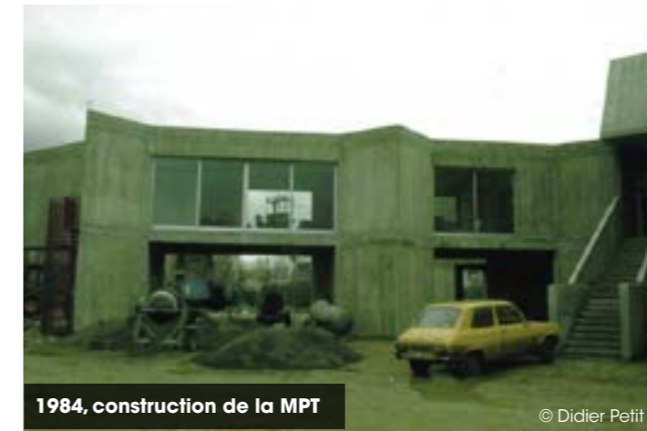
1984, construction de la MPT