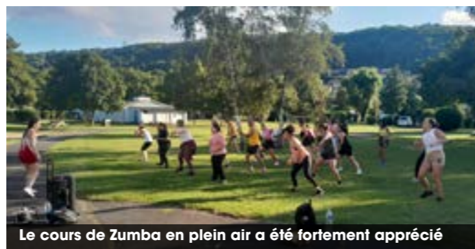
Le cours de Zumba en plein air a été fortement apprécié