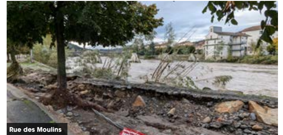
Rue des Moulins

Parmi les infrastructures endommagées, on note la passerelle fusible du pont de la Chartreuse, qui devra être reconstruite , l'aire de jeux pour enfants, l'ascenseur de la médiathèque inondé, et le