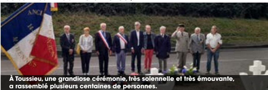
À Toussieu, une grandiose cérémonie, très solennelle et très émouvante, a rassemblé plusieurs centaines de personnes.

Il reste du devoir de mémoire de se souvenir des martyrs de Toussieu pour perpétuer le souvenir de ces héros de la Résistance qui sont morts le 12 juillet 1944 à Toussieu, pour défendre la liberté.