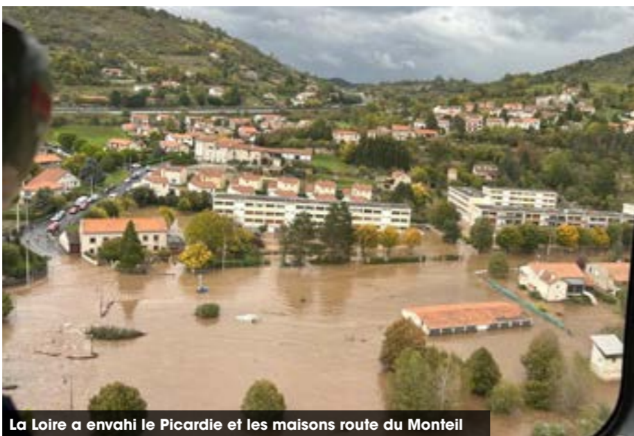
La Loire a envahi le Picardie et les maisons route du Monteil

Deux agents des services techniques sont appelés en renfort et rejoignent les élus, facilement reconnaissables à leur veste jaune fluo, pour sécuriser les zones dangereuses (bords de Loire, pont de la Chartreuse, etc.). Deux élus prennent en charge le standard téléphonique pour répondre aux appels. Nous contactons également les agents référents de la Communauté d'Agglomération et la Préfecture.