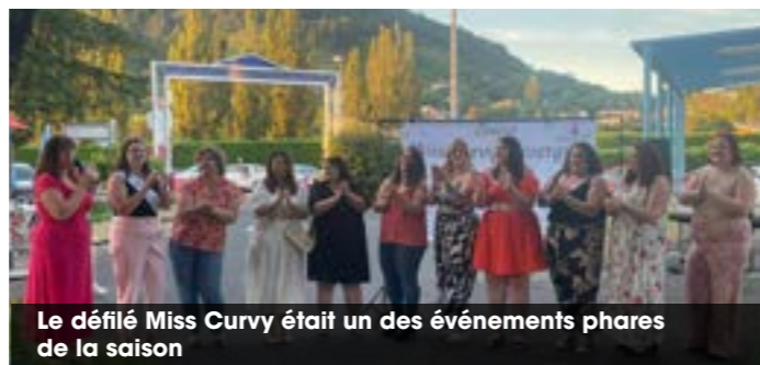
Le défilé Miss Curvy était un des événements phares de la saison