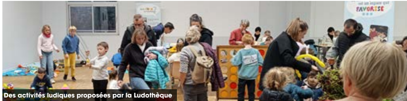
Des activités ludiques proposées par la Ludothèque

■ Le mercredi 13 novembre : un après-midi organisé à partir de temps d'animation interactifs au sein du papot'café et des différentes activités enfance / jeunesse avec notamment la présence du collectif Par les 2 bouts / théâtre d'improvisation.