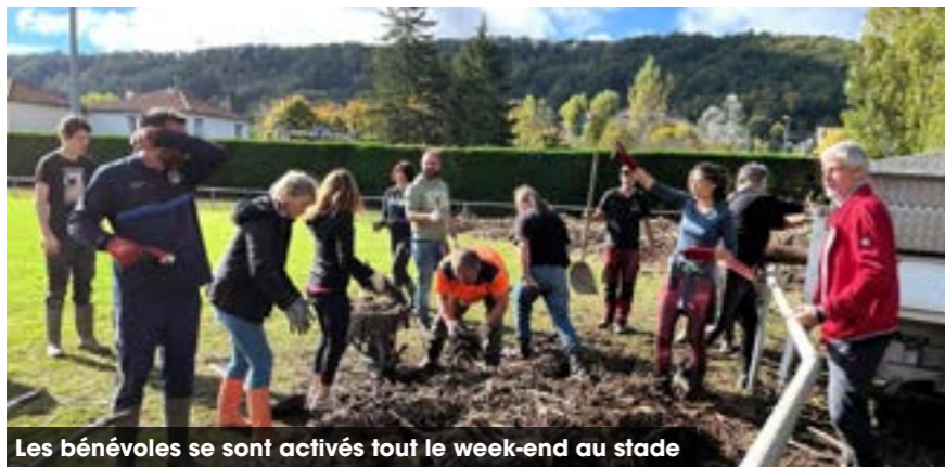
Les bénévoles se sont activés tout le week-end au stade

À l'appel des clubs locaux (foot et rugby), plus de 150 volontaires , dont des parents et des entrepreneurs locaux, se sont mobilisés avec leurs propres équipements (pelleteuses, camions, tronçonneuses,...) pour effacer les traces des dégâts. Le boulodrome est également nettoyé par les membres de l'association et les pompiers du sud-ouest. La plaine d'Audinet, transformée par l'action de ces nombreux bénévoles, a retrouvé un aspect apaisé .