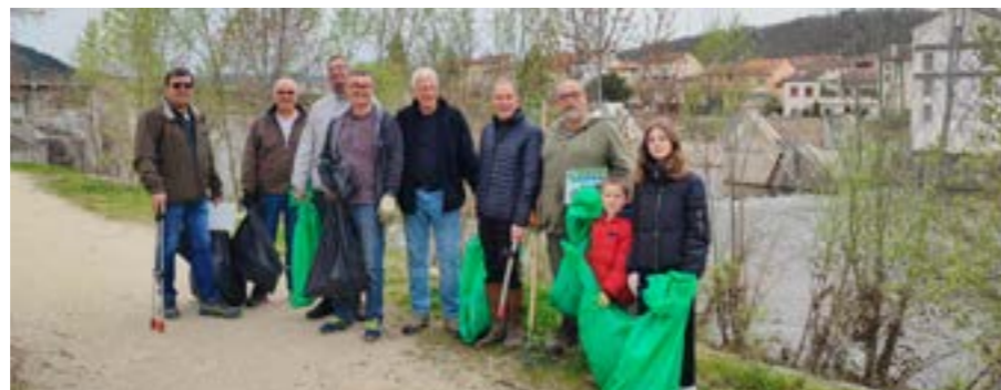
Tous les ans, à l'occasion du nettoyage des bords de Loire, de nombreux déchets sont ramassés.

chaque printemps une collecte de déchets , réunissant une cinquantaine de bénévoles. Cette action collective permet de prendre conscience de l'ampleur du problème en constatant le volume des déchets ramassés en une matinée seulement !