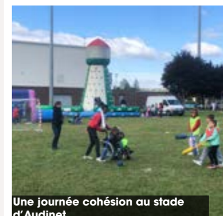
Une journée cohésion au stade d'Audinet

L'ensemble des élèves s'est montré enthousiaste à l'idée de participer à une journée de cohésion début septembre. Ils ont participé à des ateliers